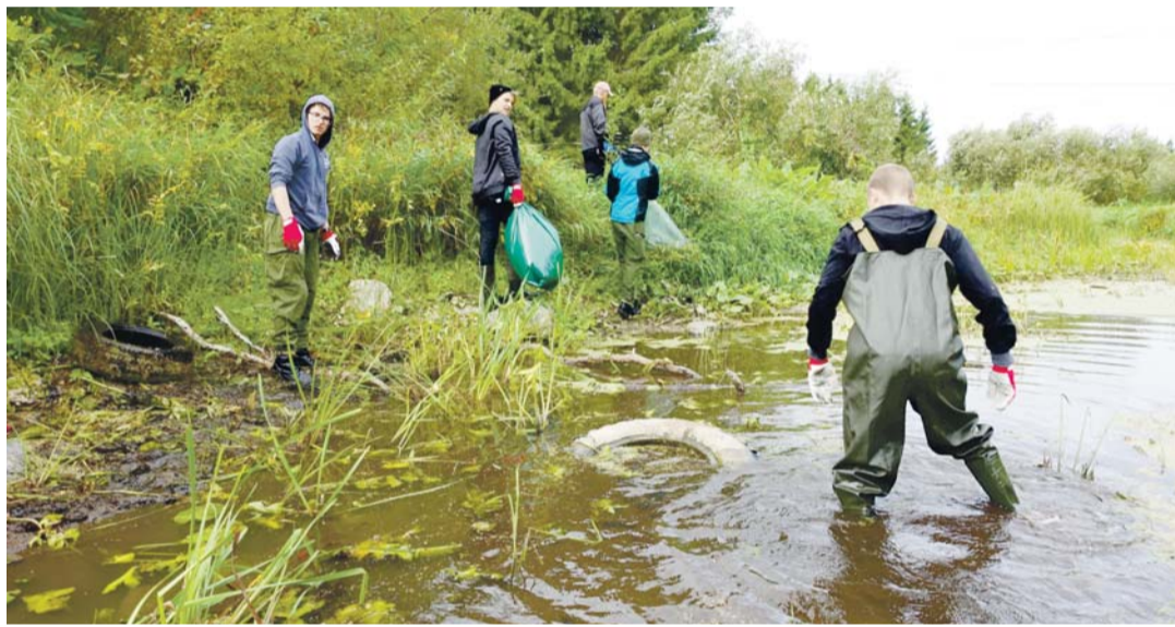
Koristustalgud Kostivere karstiaala, tööhoos on Kostivere kooli 8. klassi poisid.