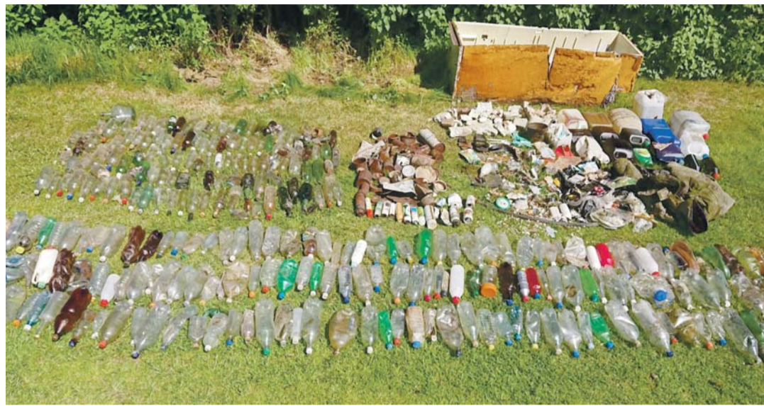
Maikuus Jägala jõe kaldalt 800 m ulatuses kogutud praht.

Tol päeval ja varasemalt jõgede äärest leitu põhjal julgesime kalamehed laias laastus kaheks jagada: hoolivad kalamehed, kes ei jäta oma prügi maha ning korjavad ka teiste jäetu